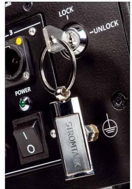
Ohne Schlüssel geht nichts: Der Stromtank will per Schlüsselschalter in Betrieb genommen werden

Zum in einem abschirmenden und als Kühlkörper fungierenden Alu-Gussgehäuse steckenden BMC gehört eine hochwertige Ladeelektronik, die die Akkus immer mit dem Maß an Energie versorgt, das ihnen genehm ist. Sicherheit, maximal effiziente und schonende Ladung der Akkus stehen hier ganz oben, was einen nicht unerheblichen technischen Aufwand bedingt. Gleiches gilt für das hoch spezialisierte Schaltnetzteil, das aus den 24 Volt der Akkus wiederum einen blitzsauberen Netzsinus generiert. Der S 2500 kennt zwei Betriebsarten: Im netzgestützten Betrieb werden einerseits die Akkus – so erforderlich – geladen, andererseits dient die gespeicherte Energie als zusätzlicher Puffer für die drei Netzausgänge. Jene sind aber in diesem Falle leitend mit dem Netz verbunden. Schaltet man (zum Beispiel mit der niedlichen beiliegenden Fernbedienung) auf „Grün“, dann wird der Netzeingang per Relais abgetrennt und die Akkus übernehmen komplett die Versorgung der angeschlossenen Last. Eine Leuchtdioden-