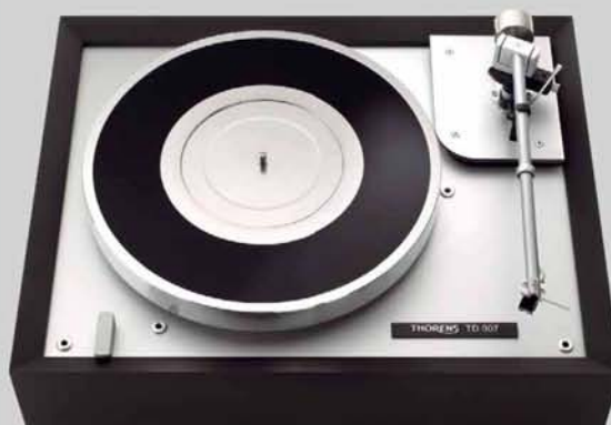
Plattenspieler TD907 Reichmann-AudioSysteme.de