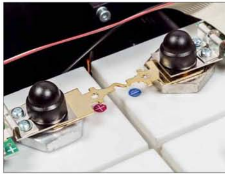
Wenn alles andere versagt: Diese Sicherung ist die letzte Rettung im Falle eines Kurzschlusses