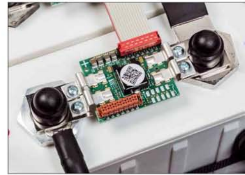
Wachdienst: Jeder der acht Akkus wird von so einer Platine überwacht

dienung brachte Gewissheit: Da geht tatsächlich noch was. Die Stimme wirkt noch fokussierter und verliert die letzte Körnigkeit. Und tatsächlich: Es rauscht in den Pausen zwischen den Titeln merklich weniger – das hätte ich nicht gedacht. Die direkte Umschaltmöglichkeit macht den Vergleich recht einfach, der Klang folgt dem Umschalten mit ein wenig Verzögerung. Hier funktioniert's super, bei gehobener Zimmerlautstärke vermeldet das gewaltige Anzeigeinstrument im reinen Akkubetrieb gut acht Ampere Entladestrom. Rechnen wir mal hoch: Diese Last sollten die Akkus ohne Nachladen rund zwölf Stunden lang stemmen können. Das reicht dicke.