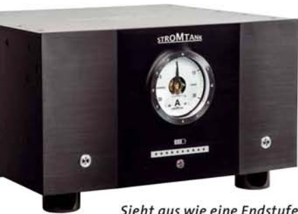
Sieht aus wie eine Endstufe, ist aber keine: Stromtank hat den endgültigen Netzaufbereiter gebaut