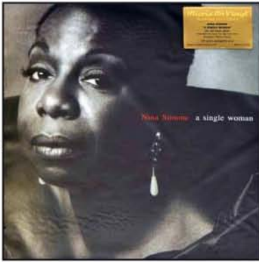
Nina Simone – A Single Woman