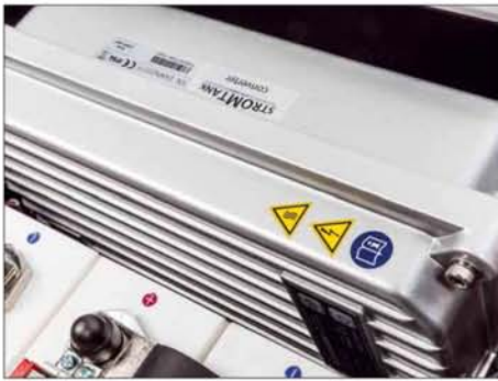
Die Leistungselektronik steckt in abschirmenden und kühlenden Gussgehäusen