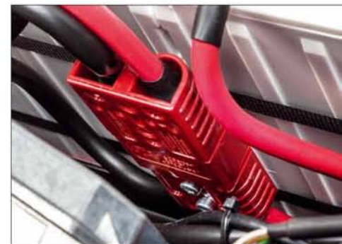
Das ist mal ein Stecker: Der Akkupack ist im Gerät über einen sogenannten Anderson-Verbinder angestöpselt